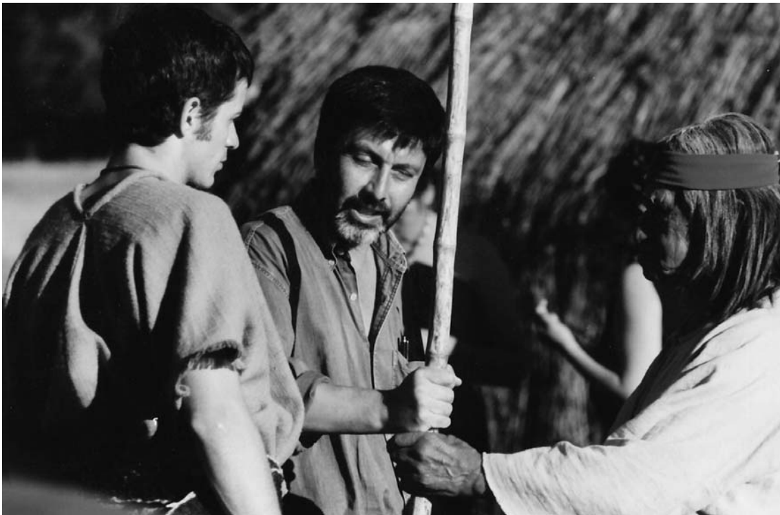
Cautiverio feliz, 1998