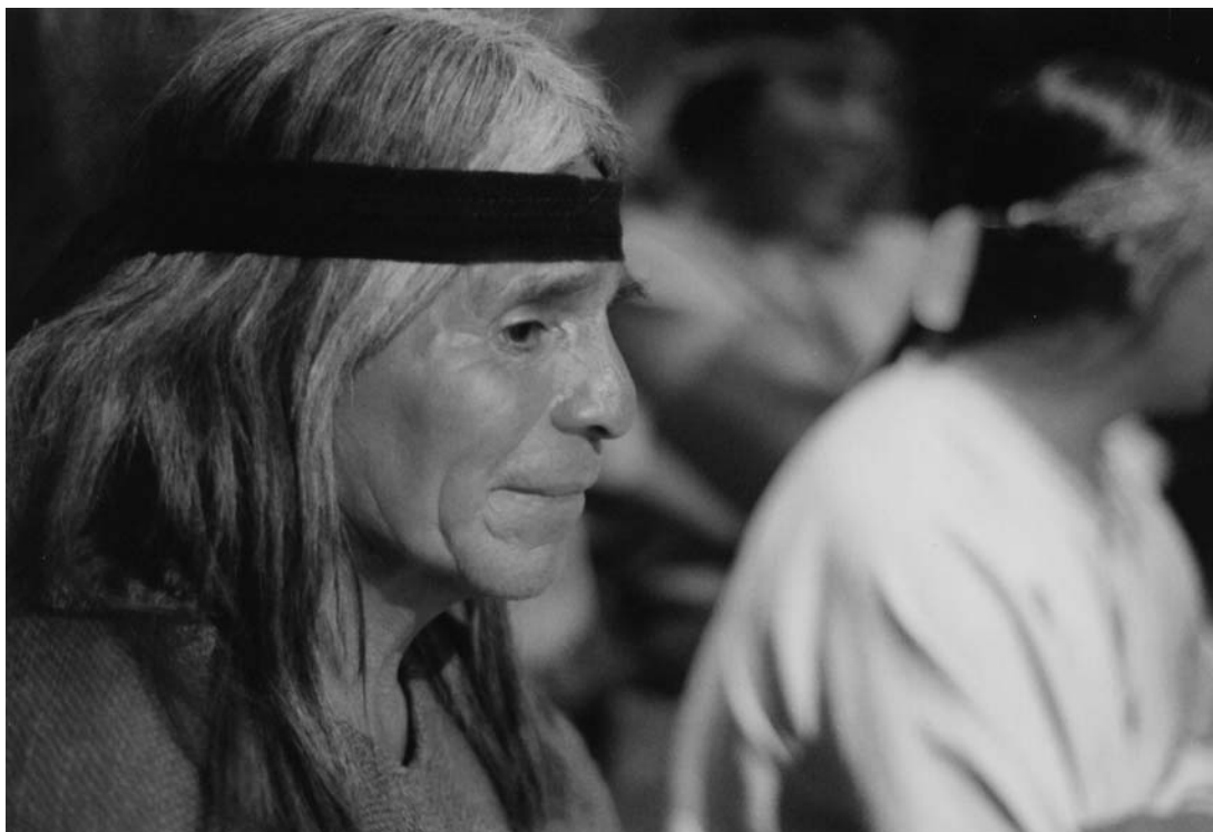
Cautiverio feliz , 1998

En El zapato chino , Gallardo rescata de un supuesto burdel a Marlene (quien ya se había desplazado de la provincia a la capital), y desde allí comienza su viaje por la ciudad tratando de encontrar un lugar