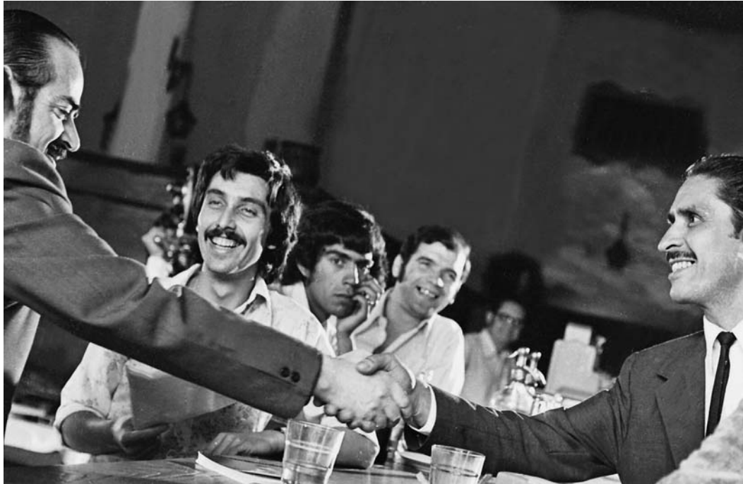
Vías paralelas, 1975

de plus, il a dû passer son temps de prisonnier à des déplacements continus pour éviter d’être assassiné par des tribus Mapuches opposées à celle qui le protégeait. Quand enfin on l’a laissé partir et qu’il a rejoint “les siens”, Álvaro Núñez ne s’est plus adapté. Des années plus tard, en écrivant ses mémoires, il a réalisé un retour symbolique, plein de mélancolie, vers ce moment de bonheur. Il avait subi une “conversion inverse” de créole à indigène.